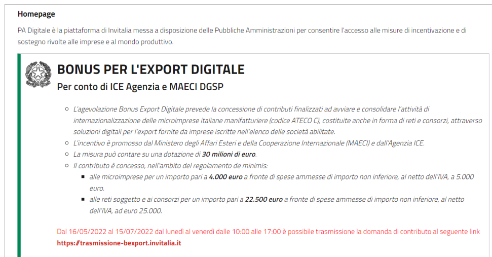
Figura 1 – Area dedicata alla misura agevolativa – link pagina trasmissione domanda

A partire dalle ore 10:00 del 16 maggio 2022 sarà possibile trasmettere la domanda di agevolazione del contributo. Per accedere alla piattaforma, occorre collegarsi al link https://sso-padigitale.invitalia.it . Nell'area dedicata alla misura agevolativa Bonus per l'Export Digitale si deve utilizzare il link in rosso, dedicato.