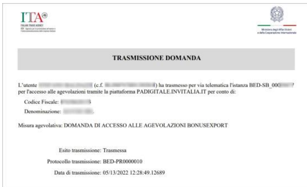
Figura 8 – pdf di attestazione della trasmissione della domanda di agevolazione al contribuuto