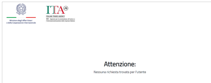
Figura 3 – Al Codice Fiscale del compilatore non risulta associata alcuna microimpresa che ha compilato una domanda non ancora trasmessa

Cliccando sul link https://trasmissione-bexport.invitalia.it l'utente dovrà utilizzare il sistema pubblico di identità digitale SPID, la Carta d'Identità Elettronica (CIE) oppure la Carta Nazionale dei Servizi (CNS) per effettuare l'accesso alla pagina dedicata alla trasmissione della domanda di agevolazione del contributo. All'accesso, il sistema controlla che, al Codice Fiscale del compilatore risulti abbinato almeno il Codice Fiscale di una microimpresa per la quale sia stata compilata una domanda di agevolazione al contributo non ancora trasmessa. In caso contrario non sarà possibile procedere.